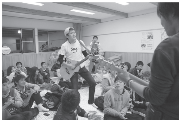
釜石のボラセンターで、支援の学 生さんたちに、歌正のサプライズ